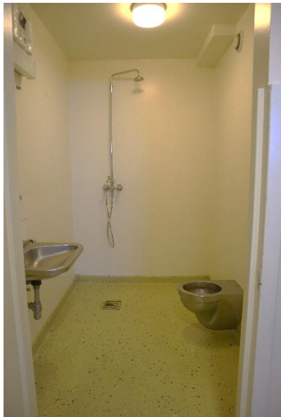
Myndir 6 og 7 Hreinlætisaðstaða í fangageymslu

eftir slíkum vörum. 30 Þar sem ekki er hreinlætisaðstaða í fangaklefum er jafnframt mikilvægt að brugðist sé skjótt við óskum kvenfanga um aðgang að salerni og að þar sé hægt að losa sig við tíðavörur.